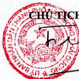
Trần Hồ Đăng